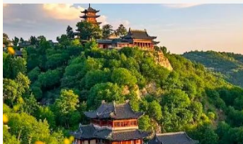
เขาเหยาหวังชาน