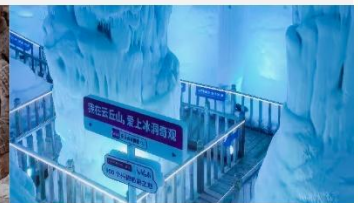
ถ้ำน้ำแข็งอวี่นชีวชาน

*ทางบริษัทฯ ขอสงวนสิทธิ์ในการสลับโปรแกรมทัวร์ตามความเหมาะสมขึ้นอยู่กับสถานการณ์หน้างาน โดยคำนึงถึงผลประโยชน์ของลูกค้าเป็นสำคัญ