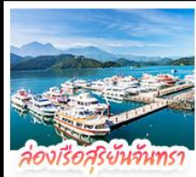
ล่องเรือสุริยจันทร์

ล่องเรือชมทะเลสาบสุริยจันทร์ (SUN MOON LAKE) ชมทะเลสาบ หวง-ฉีตง • อีสระเคินเล่น หนูนาน้อต้าซ่า • นั่งรถไฟเล็กโบราณ (1 สามี) สัมผัสบรรยากาศเส้นทางรถไฟสายธรรมชาติ • กล้วย ไร่โกจิโกจิ • ไร่ชา แหล่งรวมแฟชั่นและสตรีทฟู้ด • ซุปบึงย่าน ซิเหมินตง (XIMENDING) ถ่ายรูปแลนด์มาร์ค ดึกไทเป 101 • ช้อปปิ้งที่ MITSUI OUTLET PARK ชมความสวยงามของ อนุสรณ์สถานเจียงไทเซก • ขอฟรควรรักที่ วัดหลงชาน ชมโศกตึ่มเศียรราชินีที่ เย่หลิว • ชมบรรยากาศเมืองเก่าที่ จิวเฟิน