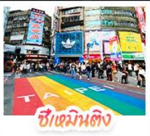
ซีเหมินตง