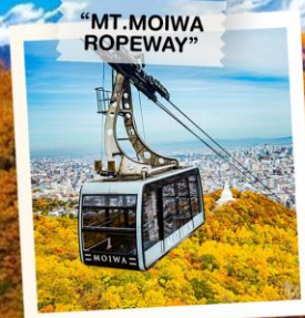
“MT. MOIWA ROPEWAY”