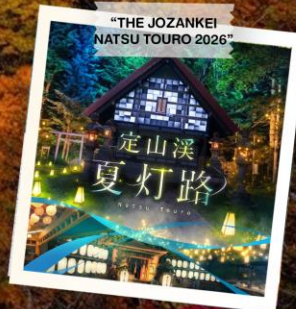
“THE JOZANKEI NATSU TOURO 2026”

วันเดินทาง 23 - 28 ต.ค. 2569 (วันปืยมหาราช) 28 ต.ค. - 2 พ.ย. 2569 30 ต.ค. - 4 พ.ย. 2569