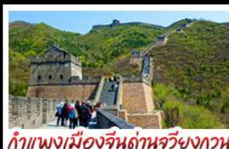
กำแพงเมืองจีนด้านจวิ้นกวน

รถไฟความเร็วสูง - ถ่ายรูปหอนาฬิกา กำแพงเมืองจีนด้านจวิ้นกวน มือพิเศษ เปิดปักกิ่ง, สุกัหม้อไฟ BUFFET