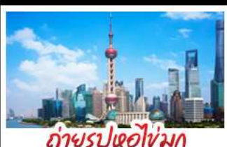
ถ่ายรูปหอไข่มุก