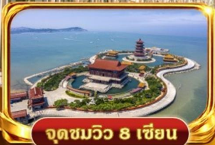
จุดชมวิว 8 เชียง