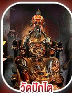
วัดปิกไต้