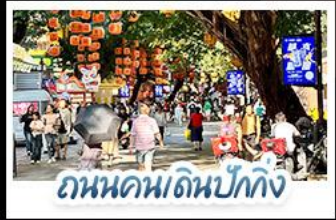
ถนนคนเดินปักกิ่ง