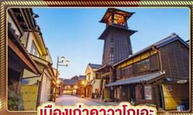
เมืองเก่าคาวาโกเอะ