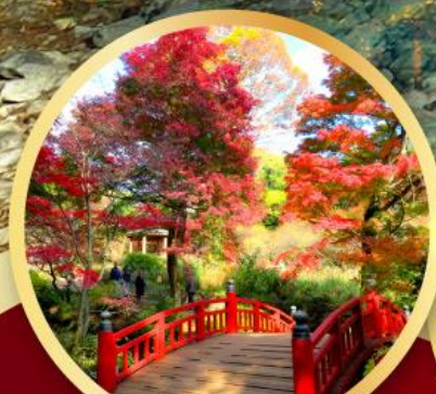
สวนดอกบ๊วยอาคาบิ