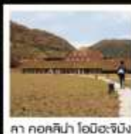
คา คอสคิน่า โอมิอะจิมัง