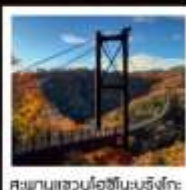
สะพานแขวนโฮชิโนะบุรังโกะ