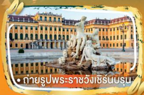
• ถ่ายรูปพระราชวังเซรินบรุน