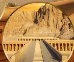
หุบเขากษัตริย์