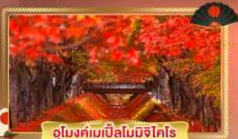
อุโมงค์เหมืองเกลือมิซึโงโตะ