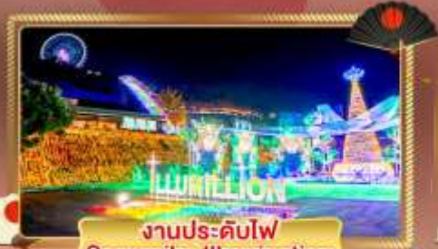
งานประดับไฟ Sagamiko Illumination