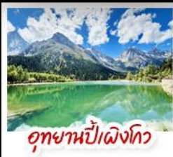
อุทยานป่าฝิ่งโกว

มรดกโลกพระพุทธรูปแกะสลักหินต้าจู้ - อุทยานหลุมบ่อฟ้าสะพานสวรรค์ อุทยานเขานางฟ้า - หงหยาดัง - ดิกยูชิง ชั้น 22 - ชมรถไฟรถไฟฟ้าทะเลสี สะพานโบราณหนานเฉียว - เมืองโบราณกวนเซี่ยน - อุทยานภูเขาสี่ดรุณี อุทยานป่าฝิ่งโกว - ถนนโบราณชอยกวางชอยแคบ - วัดต้าอ้อ ถนนคนเดินซุนซีลู่ - หมู่บ้านต้าปิ่นตึกIFS - ถนนไท่กู่หลี่