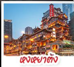
ตึกเซาตัง