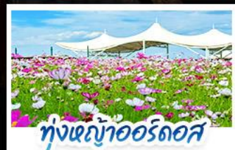
ทุ่งหญ้าเออร์คอส