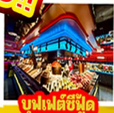
บูฟเฟต์ซีฟู้ด