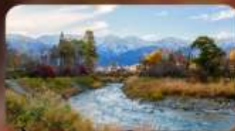
โออิเดะปาร์ค