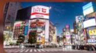
ซ้อปิ้งชินจูกุ