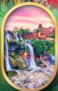
ฟูหลงเจินน้ำตก