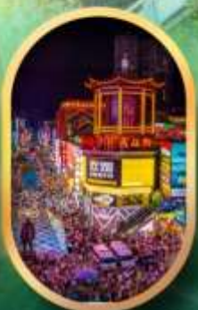
ถนนคนเดินซิงสือ