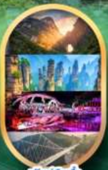
พรีเซ็นเลือกซื้อ Option เสริม