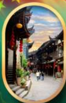
เมืองโบราณฟูหลงเจิน