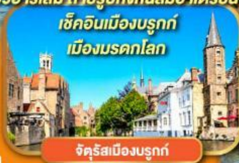
จัตุรัสเมืองบรูค