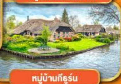
หมู่บ้านก็ธูร์น