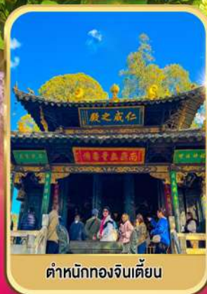
ตำหนักทองจีนเตียน