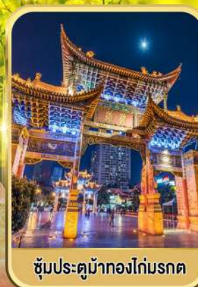
ชมประติมากรรมดอกไม้