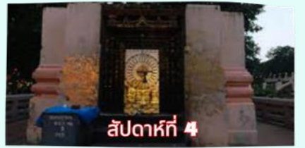
รัตนขรรเจดีย์ (ซุ้มเรือนแก้ว)

เรียบร้อยแล้ว นำคณะจาริกบุญสวดมนต์ทำวัตรเย็น บูชาพระรัตนตรัย และสวดมนต์บูชาสังเวชนียสถาน จากนั้นเชิญท่านทัศนารธรรม นั่งสมาธิปฏิบัติบูชาตามอธยาศัย สมควรแก่เวลา นัดหมายเวลาเชิญท่านกลับโรงแรมที่พัก