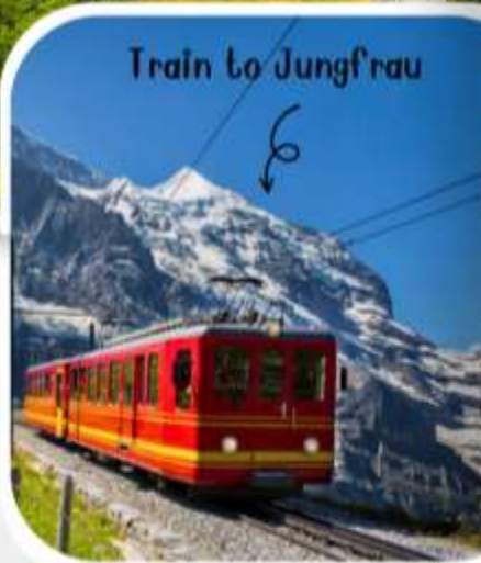
Train to Jungfrau