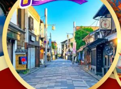
ถนนสายชาเขียว