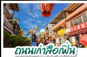
ถนงเก่าลิวเฟิน