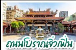
ถนงโบราณจิวเฟิน

ทะเลสาบสุริยันจันทร์ - ล่องเรือชมวิว - จิวเฟิน ลิวเฟิน - TAIPEI 101 - ซีเหมินติง หนานโถว 1 คืน ไทเป 2 คืน