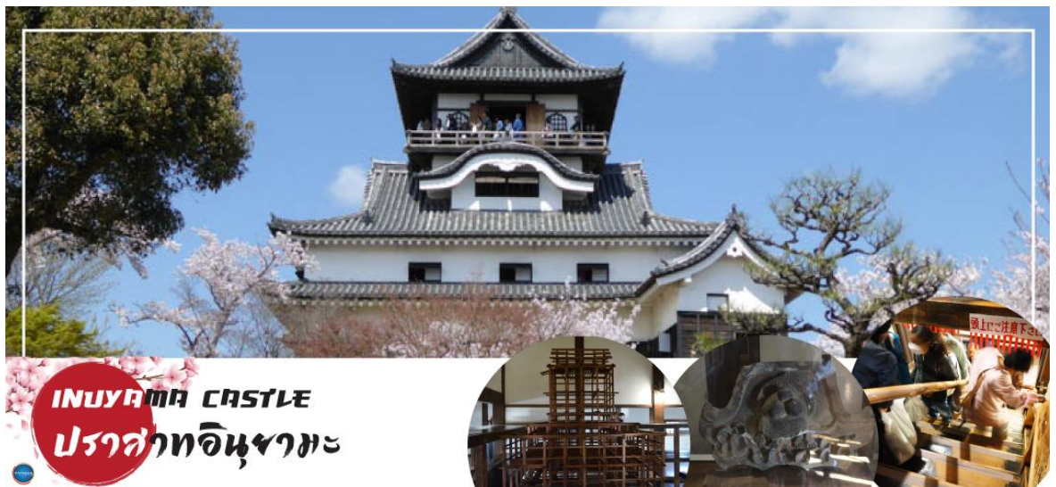
INUYAMA CASTLE ปราสาทอินยามะ

นำท่าน เข้าชม ปราสาทอินยามะ (Inuyama Castle) ตั้งอยู่ใจกลางเมืองอินยามะ ทางตะวันตกเฉียงเหนือของจังหวัดไอจิ ประเทศญี่ปุ่น เป็นปราสาทที่สร้างขึ้นในตอนปลายศตวรรษที่ 16 ที่อยู่รอดมาจนถึงปัจจุบัน ปราสาทแห่งนี้มีความพิเศษตรงที่มีหอคอยที่มีความเก่าแก่ที่สุดในประเทศ ดังนั้นปราสาทแห่งนี้จึงได้รับการประกาศให้เป็นสมบัติของชาติ ด้านในของปราสาทมีการจัดแสดงอาวุธในการทำสงครามในสมัยต่าง ๆ ของญี่ปุ่น และเราสามารถเดินขึ้นไปด้านบนเพื่อชมความงามของตัวเมืองอินยามะ ตลอดจนแม่น้ำคิโซะ และที่ราบโนบิได้