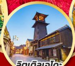
ลิตเติลเอโดะ เมืองควาโกเอะ