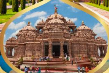
วิหารอักซาร์ตีคัม