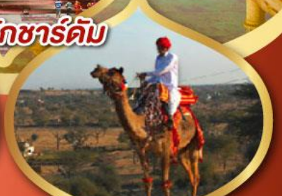
ฟรี ขี่อูฐ เมืองมันทอวา ราคาเริ่มต้น