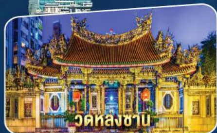
วัดหลงซาบ