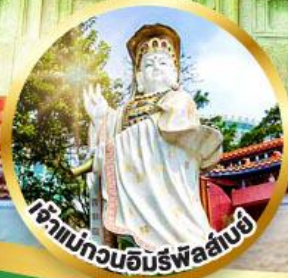
เจ้าแม่กวนอิมรพีพรล้นบุรี ขอพรรับพลังงานดี เสริมพลังดวงจัญ