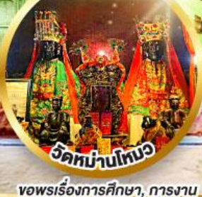
วัดบ้านใหม่ ขอพรเรื่องการศึกษา, การงาน สติปัญญาและความกล้าหาญ