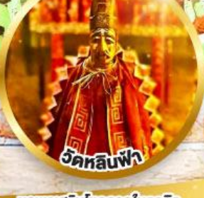
วัดลีนฟ้า ขอพรเสริมโชคลาภในธุรกิจ และการเงิน