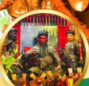
วัดกวนโก ขอพรเทพเจ้ากวนอู เงินทอง, ธุรกิจมั่นคง