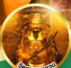
วัดห้วยหวอน ขอพรเรื่องสุขภาพ, โชคลาภ ความเจริญก้าวหน้า

เมนูพิเศษ! ต้มช้ำฮ่องกง, บุฟเฟ่ต์ชาบูสุโตลฮ่องกง, ห่านย่าง