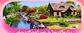
ล่องเรือชมหมู่บ้านทิวไรน์

✈️ เดินทาง 19 -26 มี.ค.69 / 27 มี.ค. - 3 เม.ย.69 2 - 9 เม.ย.69 / 9-16 เม.ย.69 28 เม.ย. - 5 พ.ค. 69 / 3 - 10 พ.ค.69