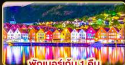
พักเบอร์เกน 1 คืน