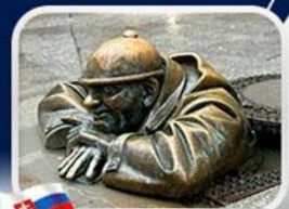
ประติมากรรม Cumil

บาเรียนพลาซซ์ • บ้านเกิดโมสาร์ท • พระราชวังฮอฟบวร์ค • ซาลส์บวร์ค • บ้านเกิดโมสาร์ท • เกรโกเดร์สตรีก • ทะเลสาบคอนิกซี • หมู่บ้านอัลลส์ตัทท์ • อนุสาวรีย์มาเรียเทเรซา