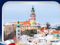
เมืองเฮลกี คุลมอฟ