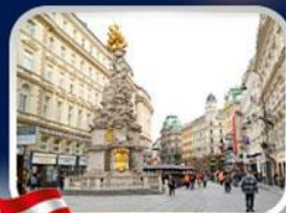
ซ็อบบิงการ์ทเนอร์สตรีก